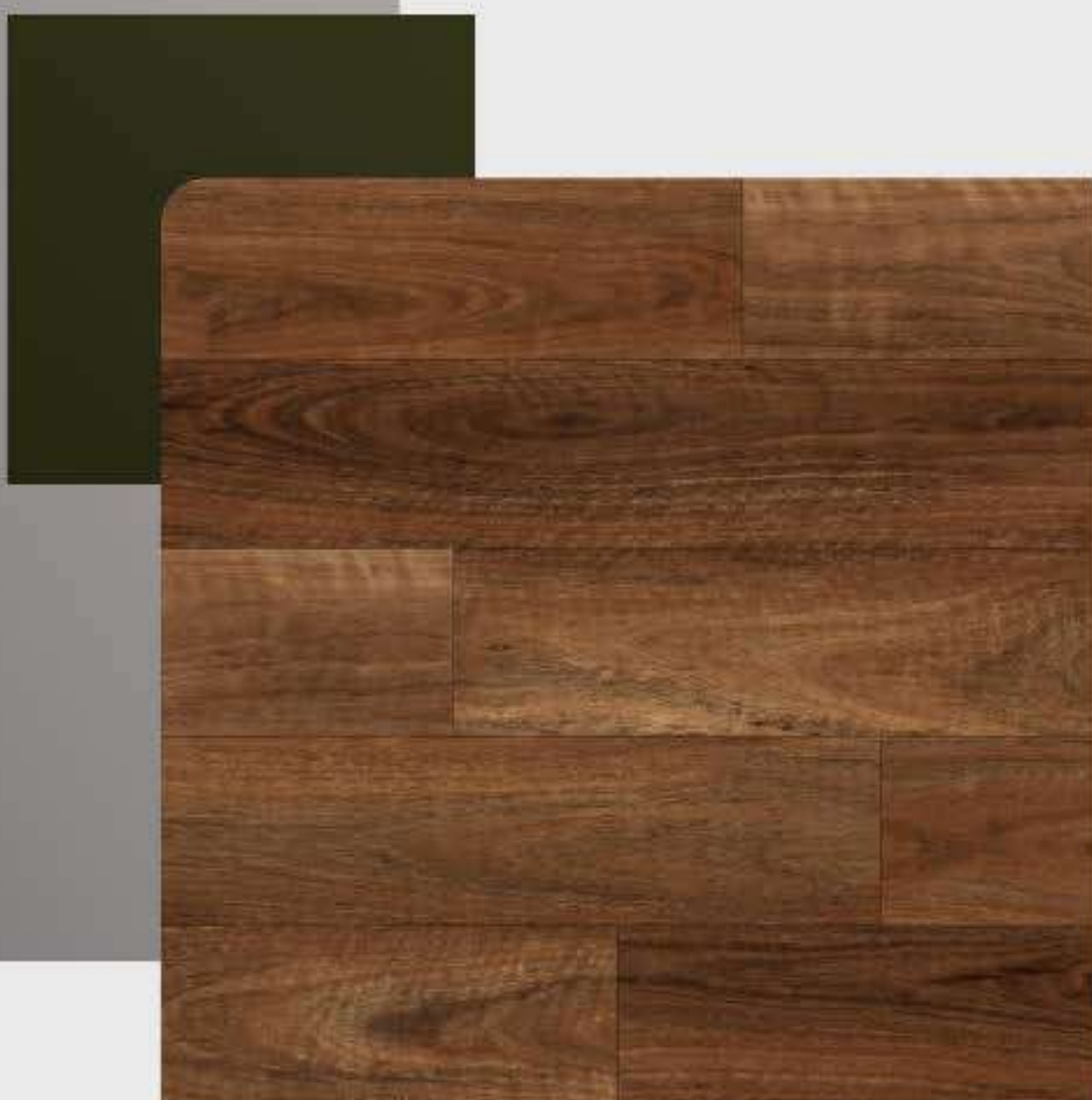
VARIAÇÃO DE TONALIDADE BAIXA