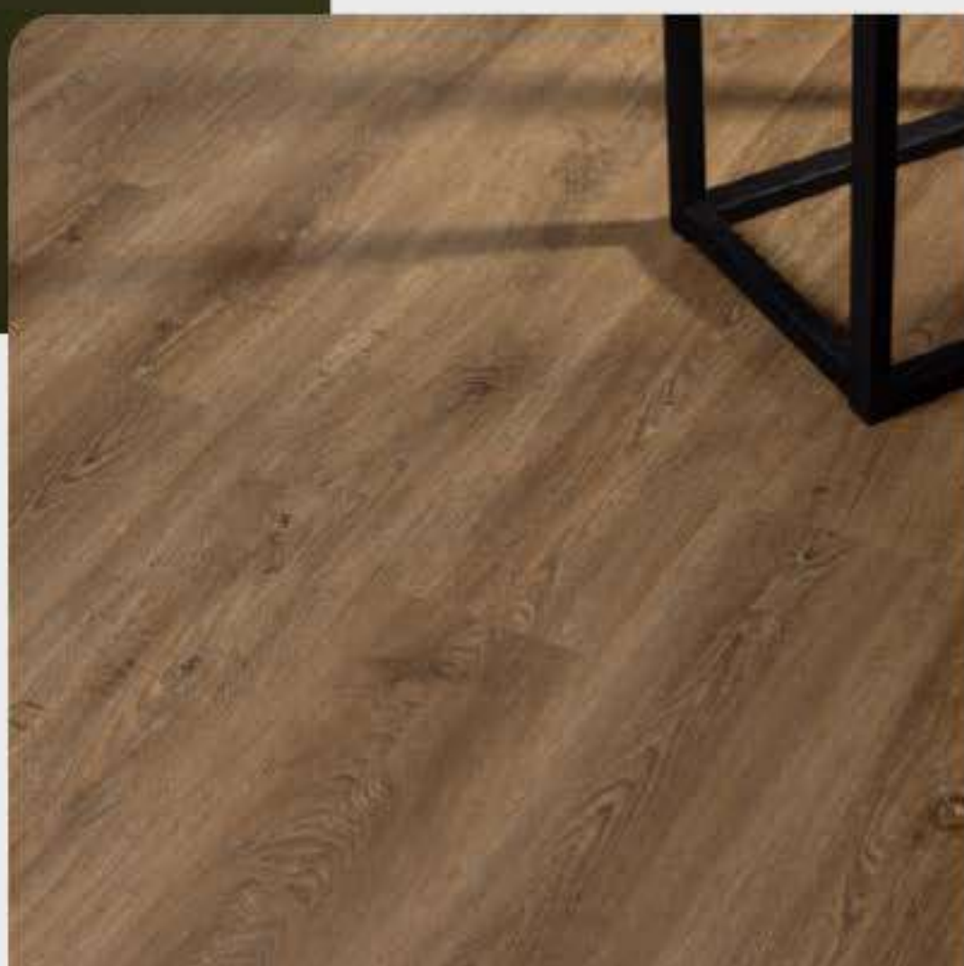
VARIAÇÃO DE TONALIDADE BAIXA

O padrão Queens é um dos pisos mais comercializados da coleção. Com tom castanho mediano, não muito escuro, é uma cor versátil que combina com muitos estilos de decoração, do clássico ao moderno ou industrial.