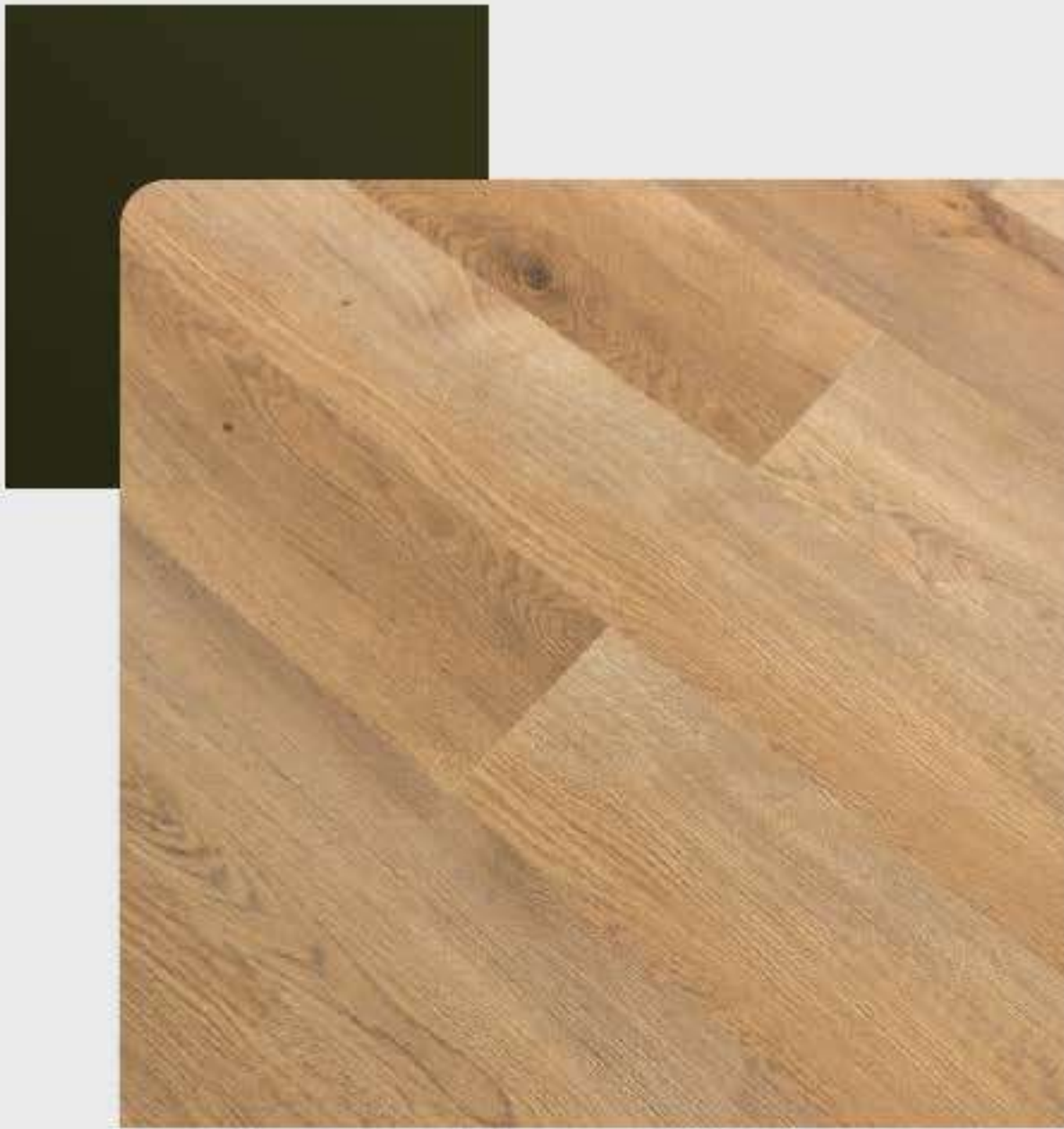
VARIAÇÃO DE TONALIDADE MÉDIA