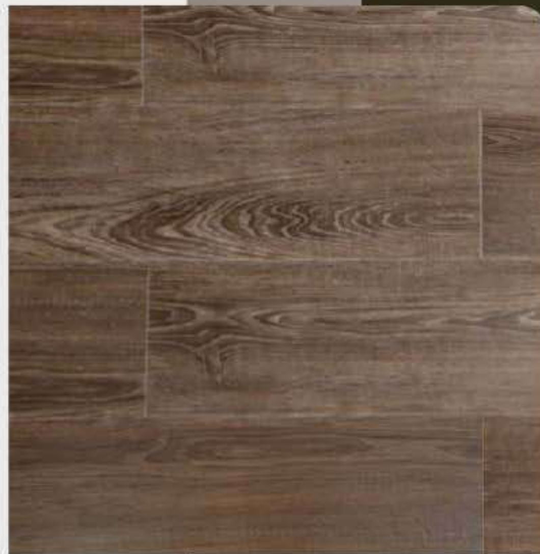
VARIAÇÃO DE TONALIDADE BAIXA

Este piso representa o Carvalho Americano escurecido e envelhecido, possui as características de madeira bem evidentes e pode ser usado em qualquer tipo de ambiente. Apresenta um visual mais discreto e uniforme, clássico e atemporal.