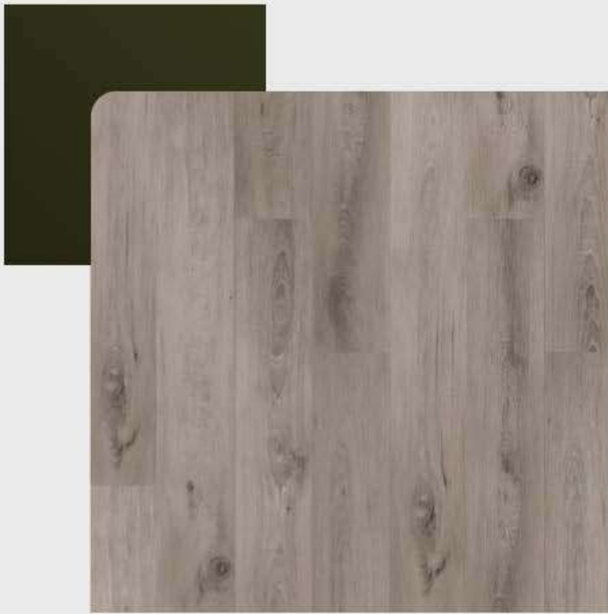
VARIAÇÃO DE TONALIDADE BAIXA