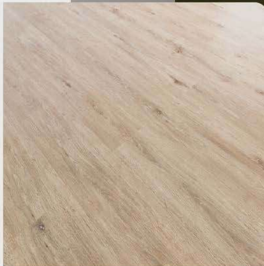
VARIAÇÃO DE TONALIDADE BAIXA

De tonalidade clara e uniforme, este piso apresenta pouca variação entre as réguas e pequenos nós eventuais. Confere ao ambiente um visual leve, com serenidade e elegância. É versátil e pode ser utilizado em qualquer tipo de ambiente.