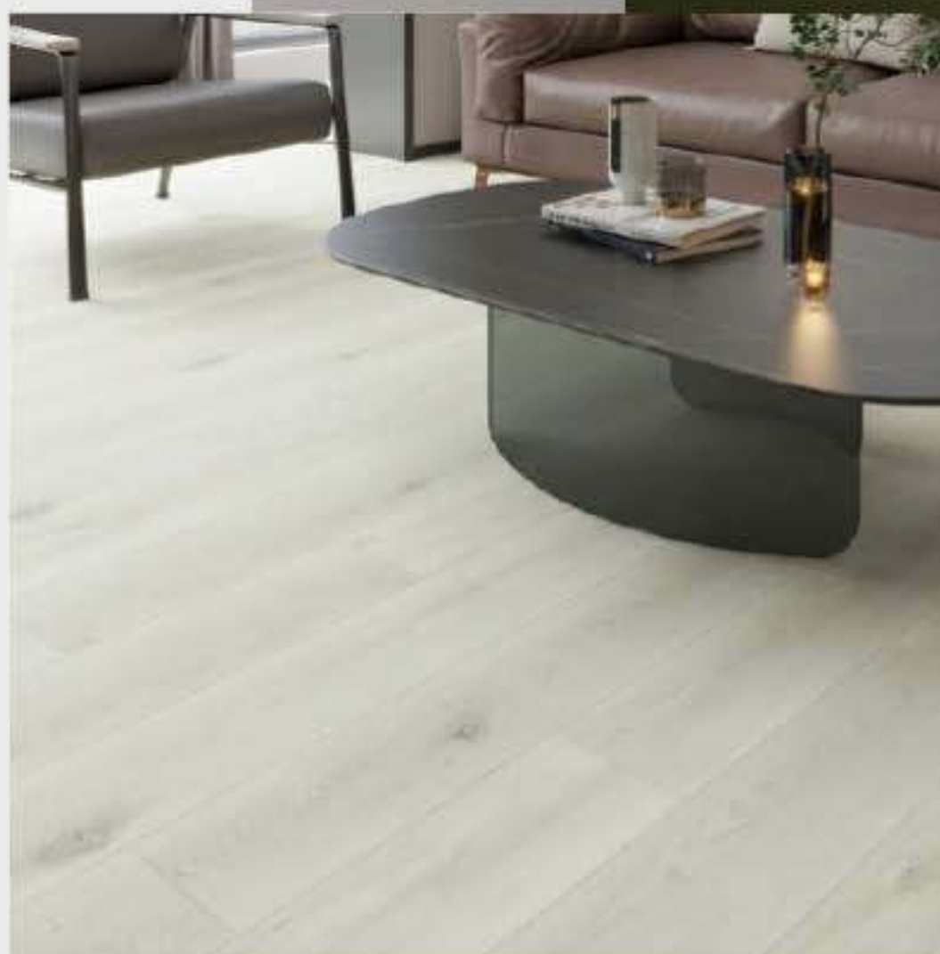
VARIAÇÃO DE TONALIDADE BAIXA

O Padrão de cor Park, simula piso de carvalho americano totalmente branco com pequenos e delicados nós e veios acinzentados. Confere ao ambiente leveza e tranquilidade.