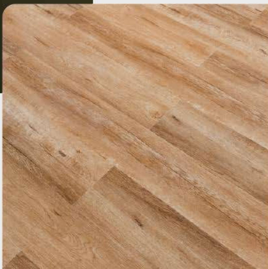
VARIAÇÃO DE TONALIDADE BAIXA

O piso Broadway é vibrante e alegre, com sua tonalidade castanho-médio e com pouca variação entre as réguas. É perfeito para espaços amplos como lojas, cafés, restaurantes, sala de estar e jantar, brinquedotecas e muito mais.